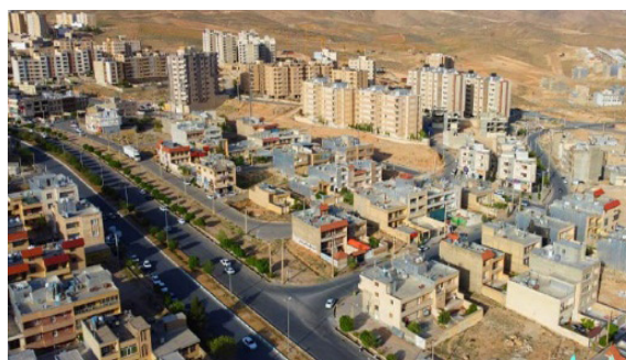
تصویر ۱. عدم پیوستگی ساختمان‌ها و ایجاد نکردن فضای تعریف‌شده در برخی مناطق شهر و وجود فضاهای خالی بسیار در سطح شهر